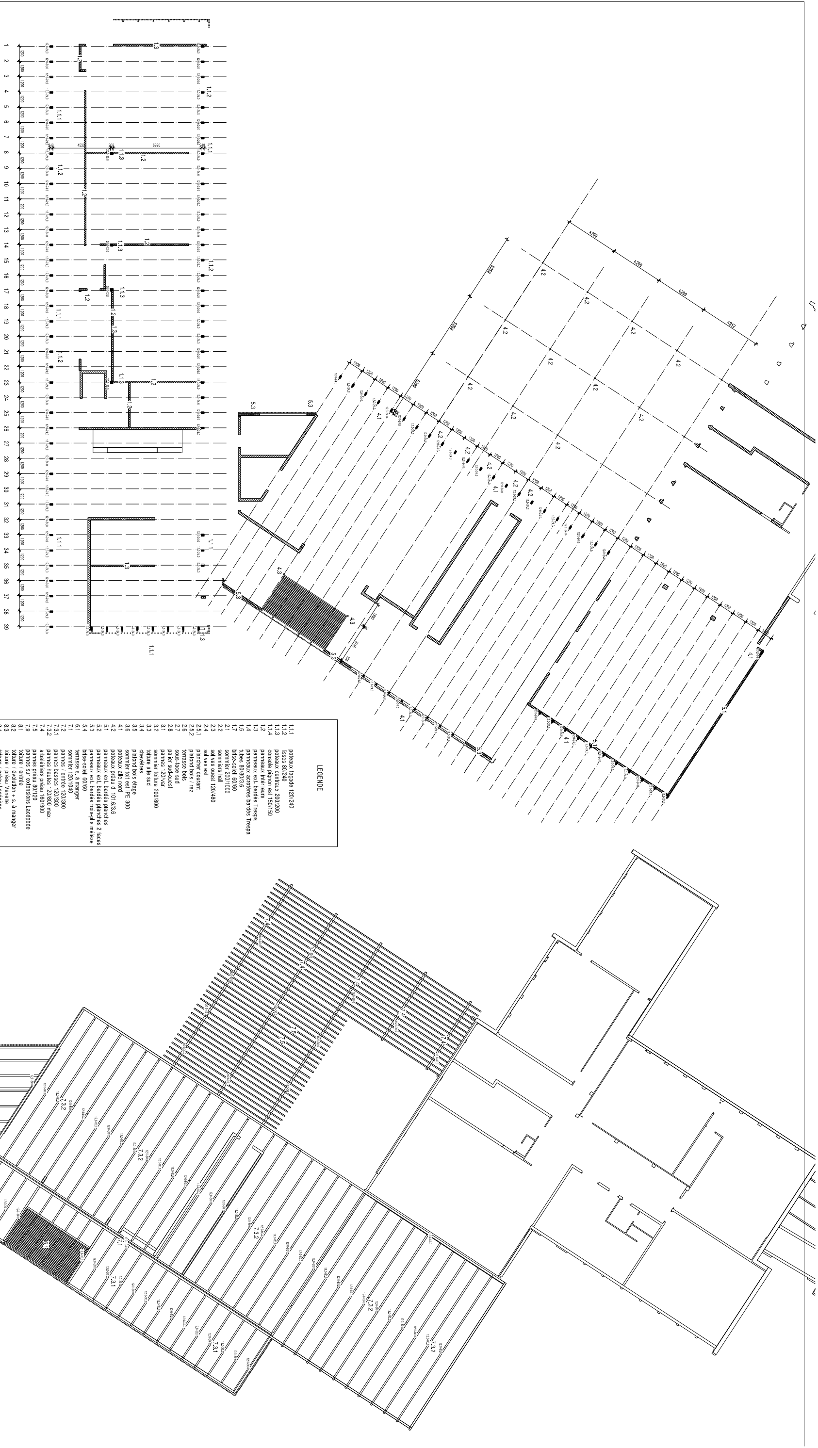
PLAN IMPLANTATION REZ 1/100